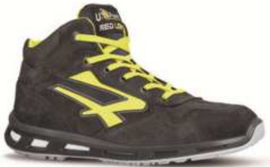
Foto modello base

Calzatura di sicurezza per uso professionale conforme alla norma armonizzata (*) EN ISO 20345:2011