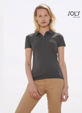
PRESCOTT WOMEN 11376