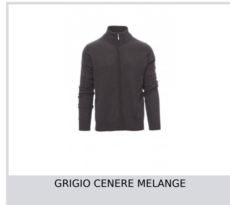
GRIGIO CENERE MELANGE