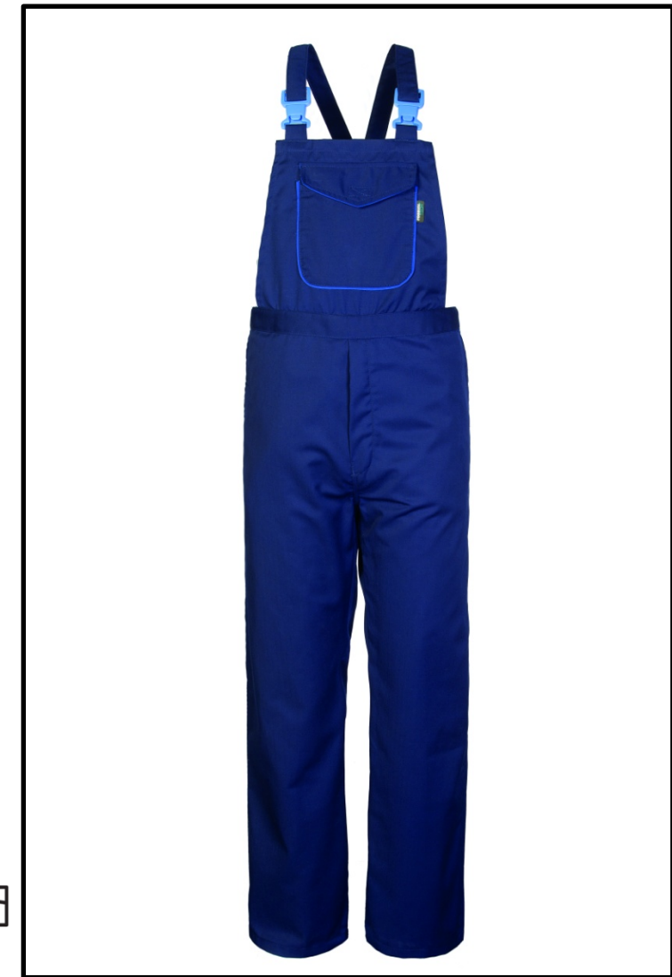
01 – BLUE