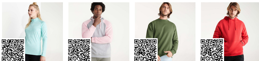
MELBOURNE WOMAN CA1114