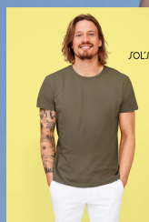
MILO MEN 02076