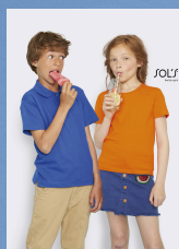
MILO KIDS 02078

Dimensioni della scatola: 52 x 32 x 20 cm weight : 7 kg