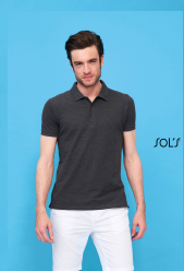
PHOENIX MEN 01708