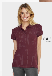
BRANDY WOMEN 01707