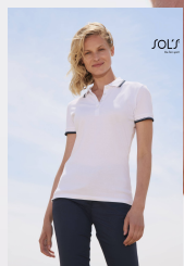
PRACTICE WOMEN 11366