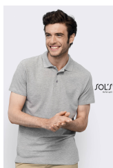
SPRING II 11362