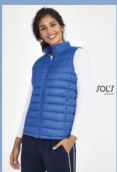
WILSON BW WOMEN 02890