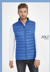
WILSON BW MEN 02889