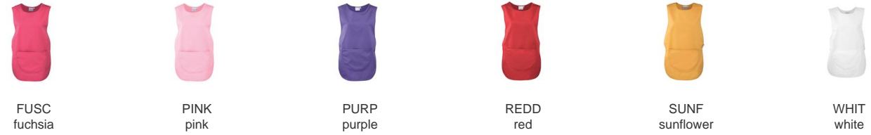
FUSC fuchsia PINK pink PURP purple REDD red SUNF sunflower WHIT white