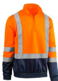
7880AB ARANCIO - BLU