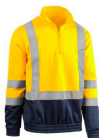
7880GB GIALLO - BLU