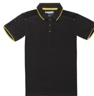
91 – WARM GREY