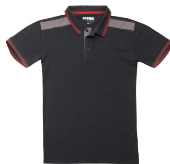
01 – BLUE

Short sleeve polo shirt with sweatband and button closure in a contrasting colour, collar with contrasting colour outline closed with three buttons, ribbed armhole with contrasting colour outline, side slits at the bottom in contrasting colour, contrasting inserts and bar tacks on the shoulders, double stitching in contrasting colour at the bottom.