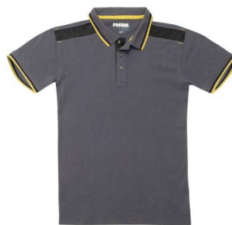
12 – GREY