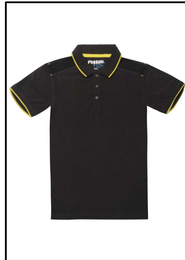
91 – WARM GREY