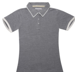
12 – GRI MELANJ