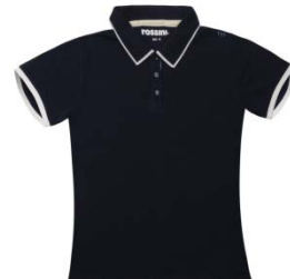
1B – BLUE GREY