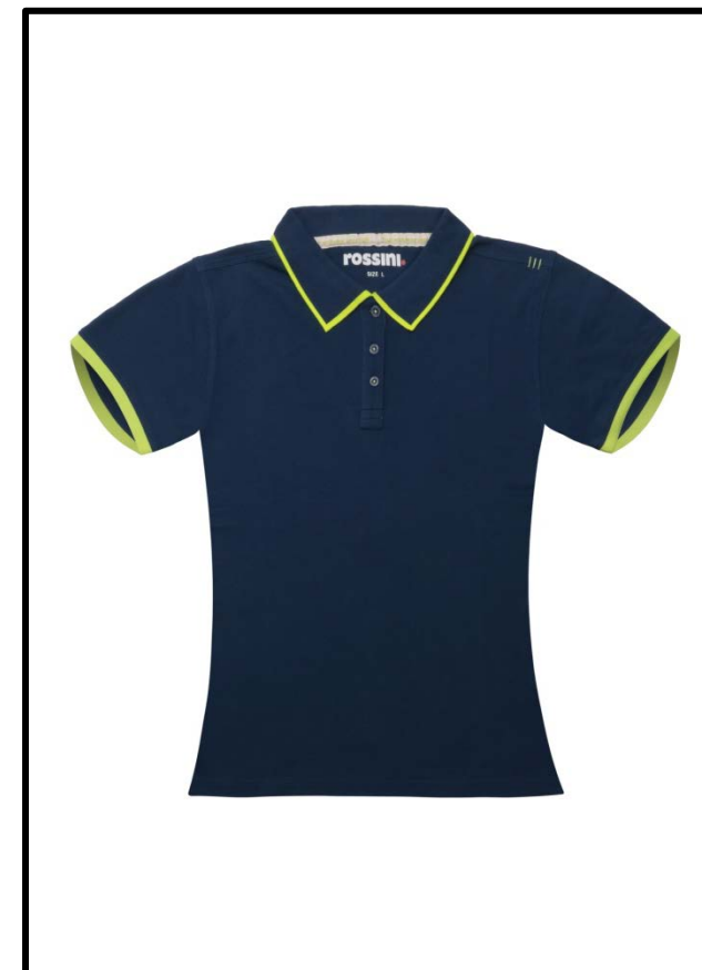
PE – PETROL BLUE