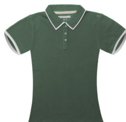
IV – VERDE SALVIA