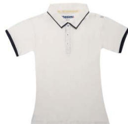
PD – PANNA