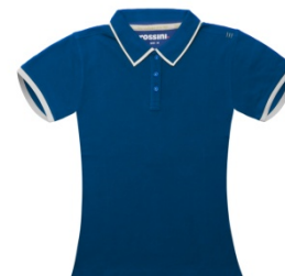
CI- COMO BLUE