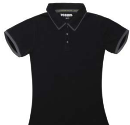
O5 – NERO