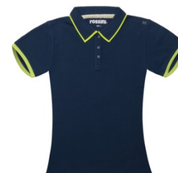
PE – PETROL BLUE