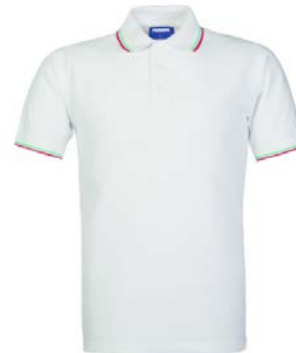
O2 – ALB/TRICOLOR