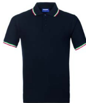
B9 – BLU/TRICOLORE