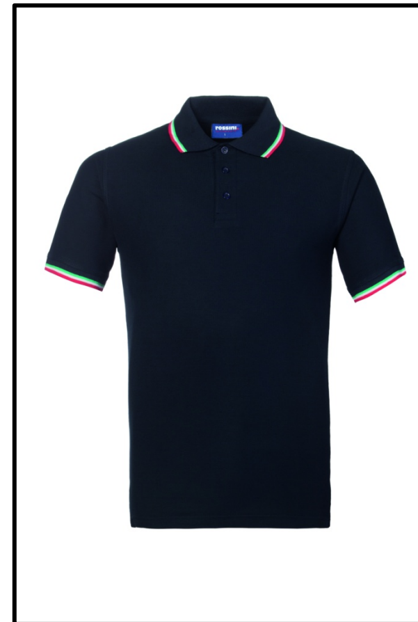
B9 – BLU/TRICOLORE