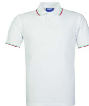
O2 – WHITE/TRICOLOUR