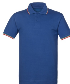
Y2 – ALBASTRU NAȚIONAL/ TRICOLOR