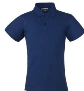
06 – ALBASTRU REGAL