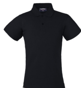
01 – BLU