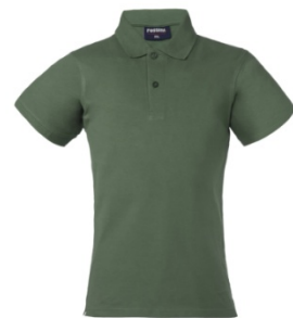
1V – VERDE SALVIA