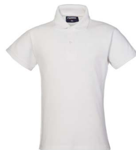
02 – WHITE