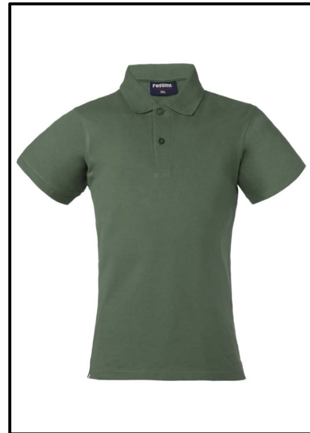
1V – VERDE SALVIA