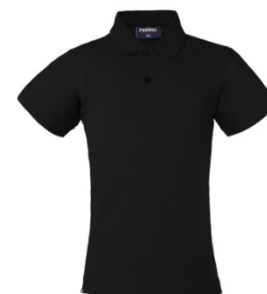
05 – NERO