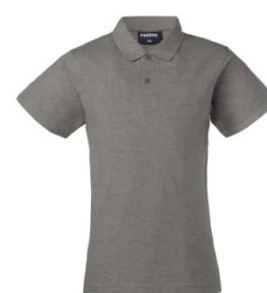
12 – GRIGIO MELANGE