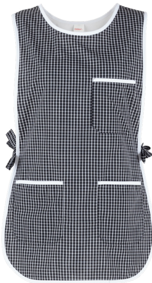
Q32 Quadro nero