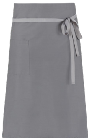
C02 Grigio chiaro