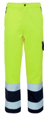
42 – GIALLO/BLU