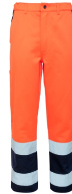
21 - ORANGE/BLUE