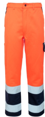
21 – ARANCIO/BLU