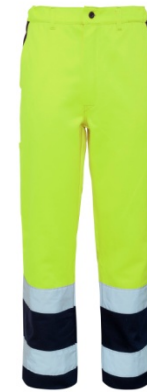
42 - YELLOW/BLUE