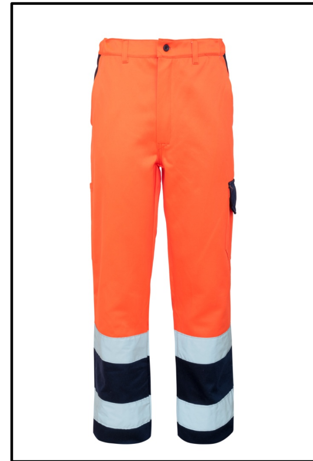
21 – ARANCIO/BLU