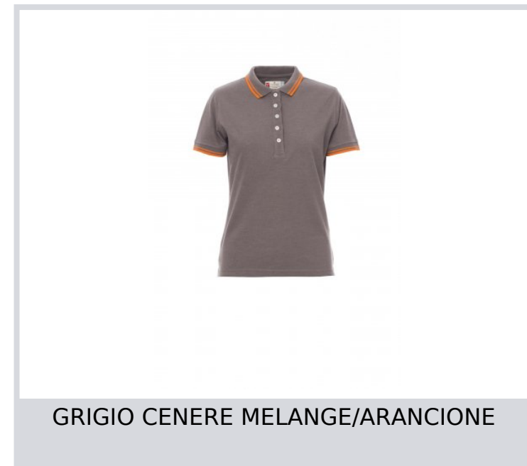
GRIGIO CENERE MELANGE/ARANCIONE