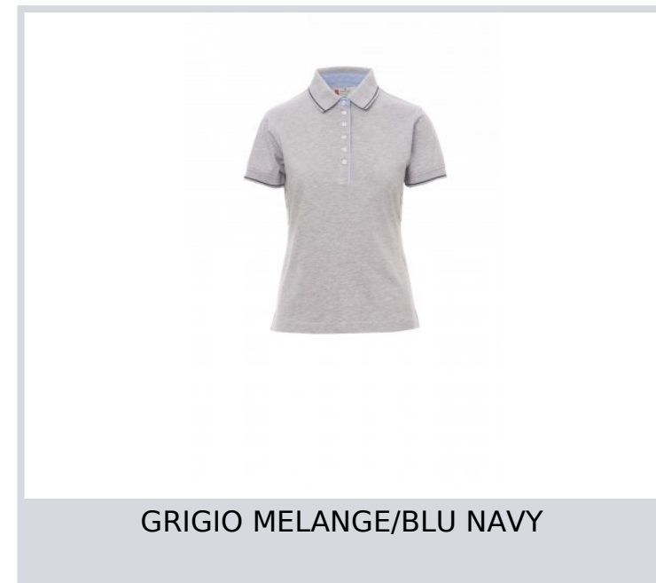
GRIGIO MELANGE/BLU NAVY