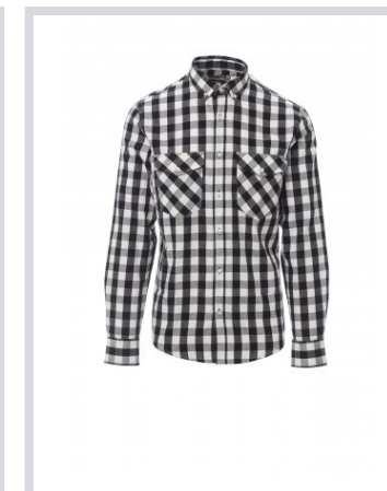
NERO/BIANCO A QUADRI