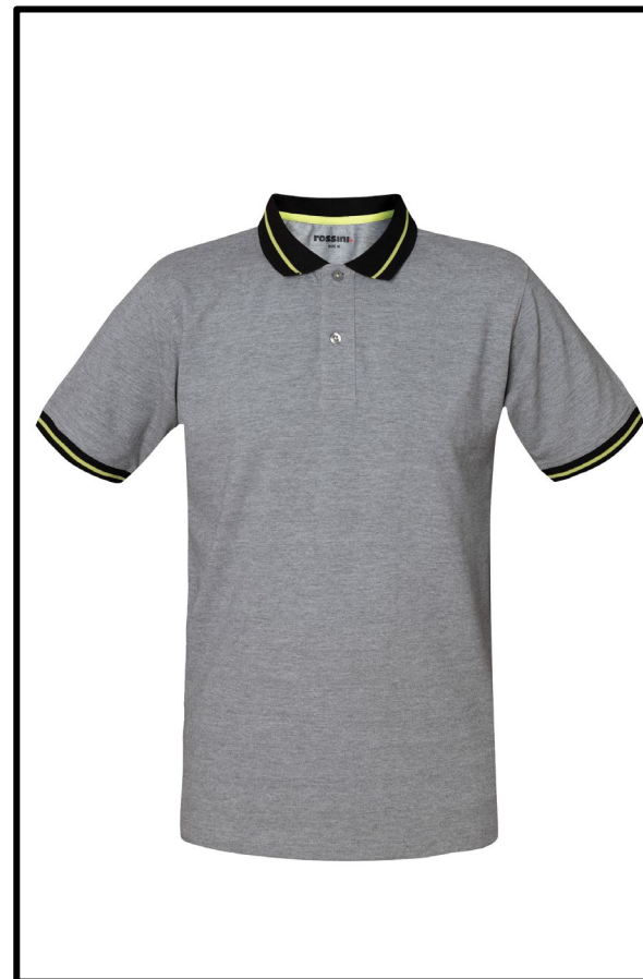
12 – GRIGIO MELANGE