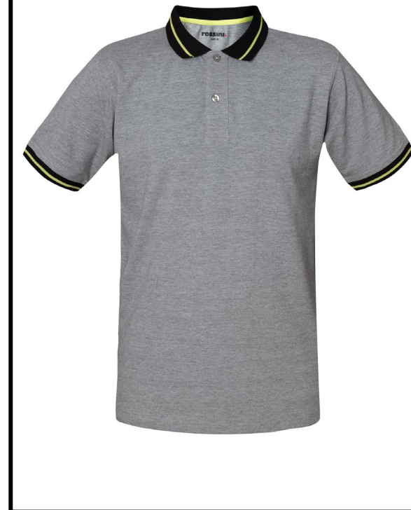
12 – GRI MELANJ