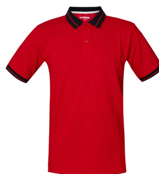
07 – ROSSO