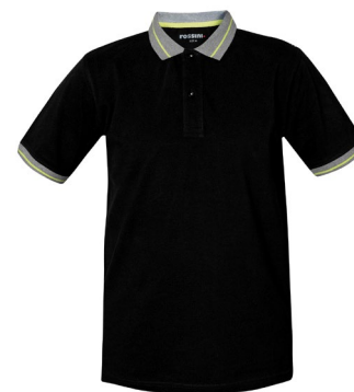
05 – NERO