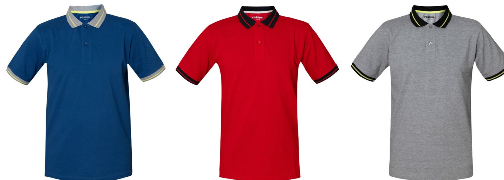
06 – AZUL REAL