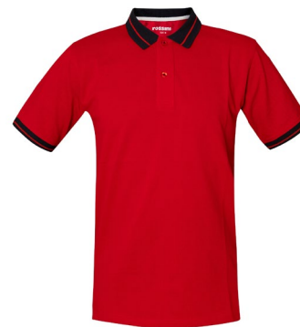
07 – RED