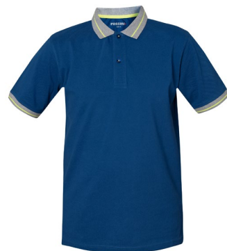
06 – ALBASTRU REGAL