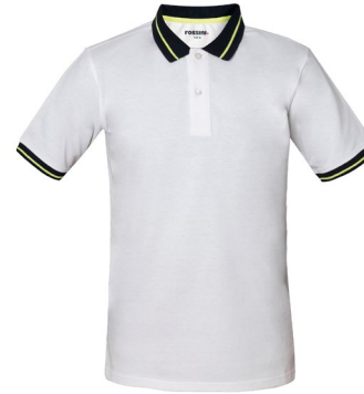
02 – WHITE