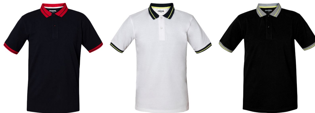
01 – AZUL