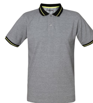
12 – GRIGIO MELANGE