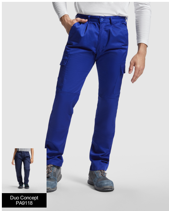
Duo Concept PA9118