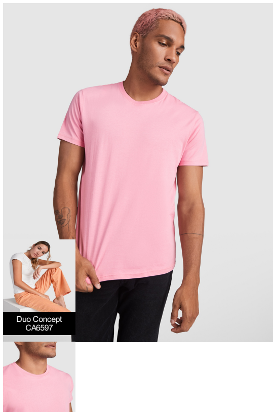
Duo Concept CA6597